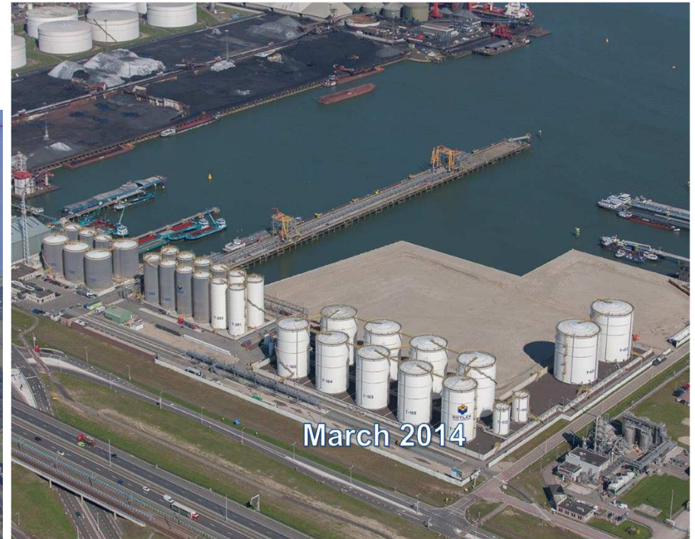
Botlek Tank Terminal